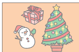
ディセムバ December 12月