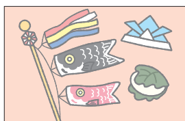
メイ May 5月