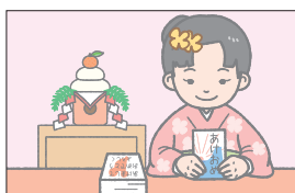
ニューイアズデイ New Year's Day 元日