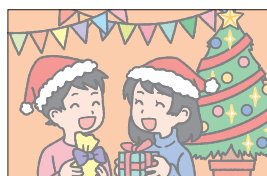
クリスマス Christmas クリスマス