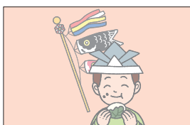
チルドゥレンズ デイ Children's Day こどもの日