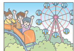
イクサイティング exciting わくわくさせる