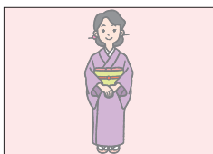
キモノ kimono 着物