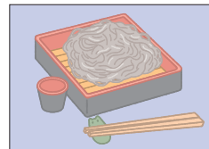
ソバ soba そば