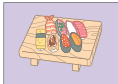
スシ sushi すし