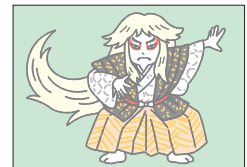
カブキ kabuki 歌舞伎