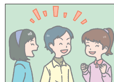
ファン fun 楽しみ、楽しいこと