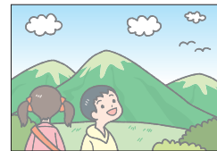
スィー see ~を見る