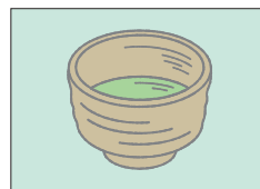
マッチャ matcha まっちゃ 抹茶