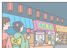
フェスティバル festival 祭り