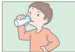
ドリンク drink ~を飲む