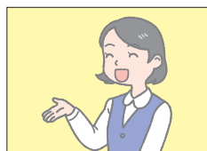
ウエルカム トゥー welcome to ~ ~によこそ