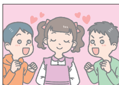
パピュラ popular 人気のある