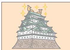
キャスル castle しろ 城