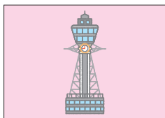
タワー tower とう タワー, 塔