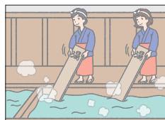
ハト スプリングズ hot springs おんせん 温泉