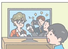
フェイス famous 有名な